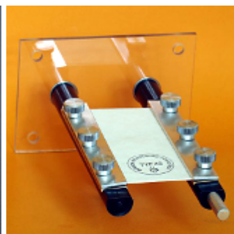
Измерительная станция PPS