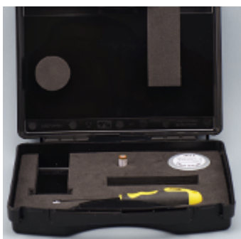
Кейс для гигрометра ННТ-3