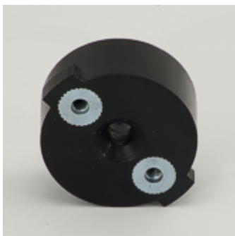
Патрон молоткового электрода