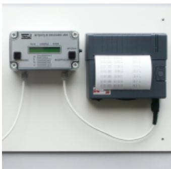
Комплект для регистрации URD