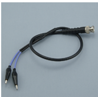
Кабель BNC - K