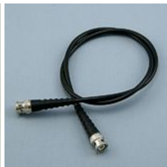
BNC - кабель BNC